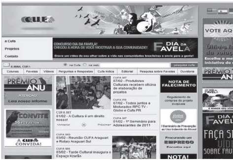
Página de inicio de la web: http://www.cufa.org.br/

dia y Londrina. Hoy hay 72 ciudades con sus puntos fuera de eje que organizan festivales, tiradas de CD, grabación, capacitación, no solo en música si no en todas las competencias que fueron adquiriendo en organización, difusión, promoción, contabilidad alternativa, esta última que les permite administrar y aprovechar su patrimonio de trabajo, es decir, gestionar. Todas estas competencias operan con programas de software libre. Podría decirse que han dinamizado un mercado alternativo de colaboraciones, sumando cada vez más pequeñas iniciativas periféricas de música. Se han sumado áreas de trabajo creativas como diseño, artes visuales, comunicación. Los 72 puntos están distribuidos en los 27 estados de Brasil, administran 44 portales/blog y alimentan diariamente el portal Fora de Eixo, central de noticias del Circuito. Tiene su propia TV en la web y producen más de 59 festivales al año, incluyendo el más grande, Grito Rock. En 2009, pusieron en circulación 1000 bandas. También han entrado en Argentina, Uruguay, Bolivia y más recientemente en Centroamérica.