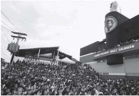
Público en una actuación en el Centro Cultural Waly Salomão, Vigário Geral, Rio de Janeiro.